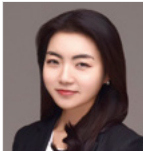
Dr. Eunjoo Chang

Department of Democracy and Citizenship, Ministry of Education